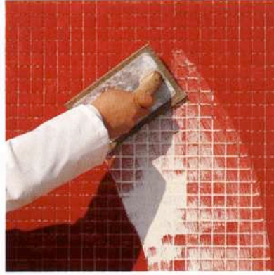
Kuva 5 a