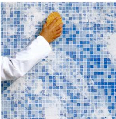
Kuva 5 b