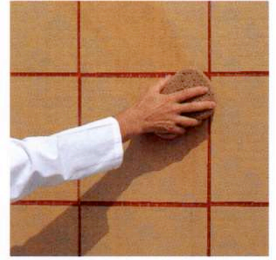
Kuva 3 a