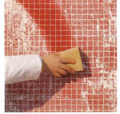
Kuva 6 a

lellisesti kiinni kiinnitysaineeseen, joko kumi- tai muovilastalla (kuva 3b). Älä käytä metallilastaa tähän työvaiheeseen. Huolehdi siitä, että mosaiikkiarkkien väliin jäävä sauma on saman levyinen muiden saumojen kanssa. Anna mosaiikkien kuivua vähintään 24 tuntia ennen saumaustyön aloittamista.