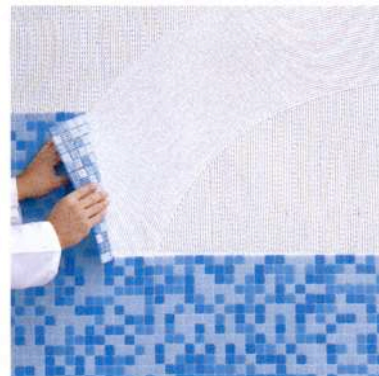
Kuva 2 b