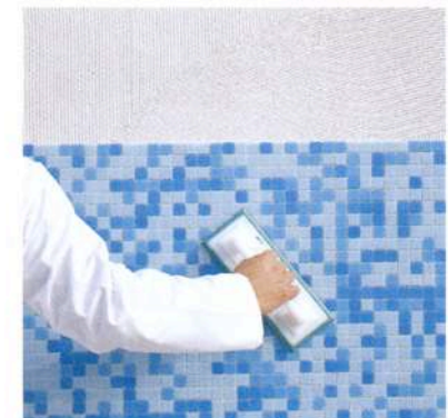
Kuva 3 b